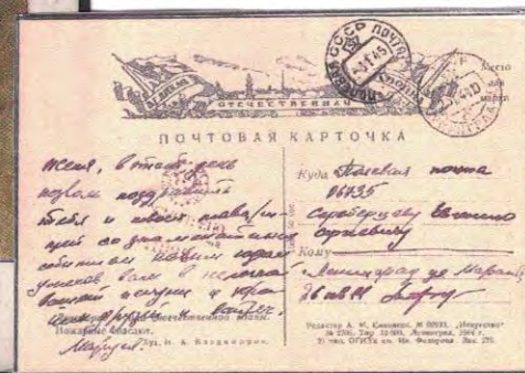
Почтовая карточка «Пожарные спасают», изображающая работу пожарных в боевых условиях из Ленинграда (22.12.1944 г.) в полевую почту №96735 (03.01.1945 г.). Проверено военной цензурой.